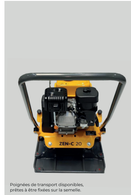
Poignées de transport disponibles, prêtes à être fixées sur la semelle.