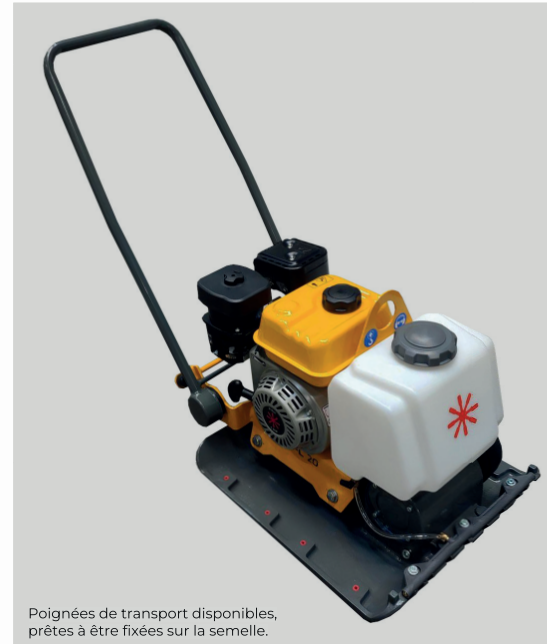
Poignées de transport disponibles, prêtes à être fixées sur la semelle.